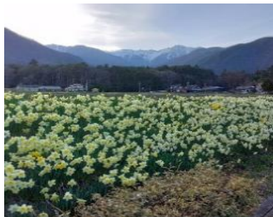
光前寺通り スイセン