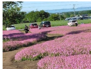
南原 フクロナデシコ