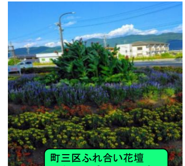
町三区ふれ合い花壇 ジニア・ブルーサルビア