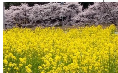
田切の里 ナノハナ