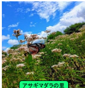
アサギマダラの里 フジバカマ