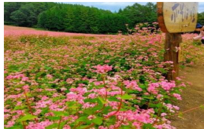
上古田 赤そばの里