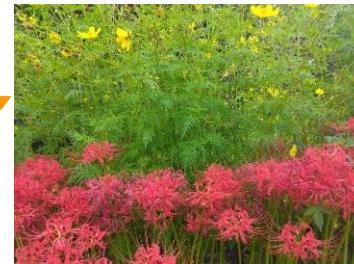
手良 キバナコスモス・彼岸花