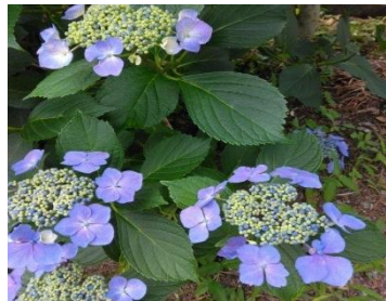
西春近 深妙寺 アジサイ