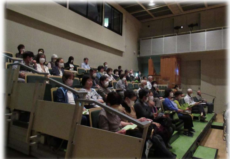
観客席はシニア大生や児童の保護者の 皆さんで満席となりました