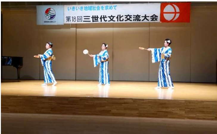
《ごより会Ⅱ》グループの皆さん 最初を飾る華やかなお祝いの舞を有難うございました