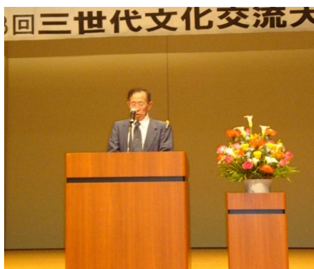
賛助会 仁科会長挨拶