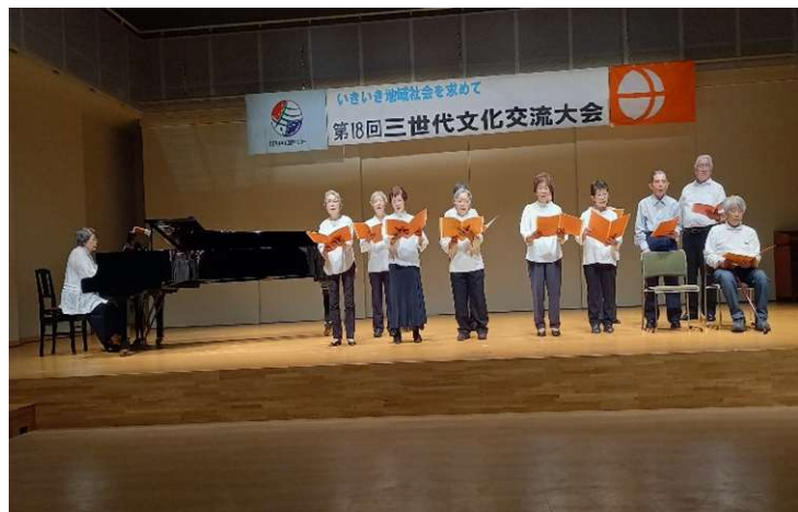
《安曇野地域会・童謡唱歌を歌う会》グループの皆さん ハーモニーが素晴らしい混声合唱団のステージです