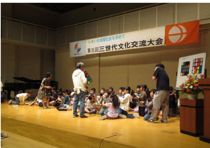
《世代交流会》グループの皆さん 島内小学校3年生の皆さんと平面キューブを楽しみました