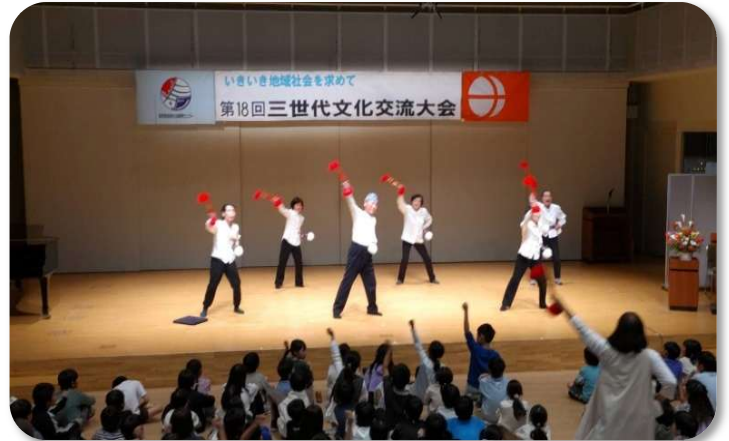
《銭太鼓を楽しむ会》グループの皆さん ステージと一体の銭太鼓の実演に会場は熱気に包まれました