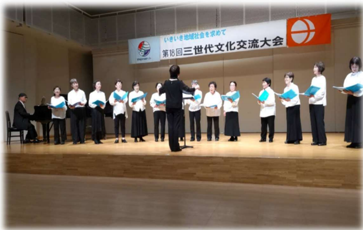
《コーラス“りんどう”》グループの皆さん 会場を静閑にしたコンサート 女性ハーモニーを楽しみました。