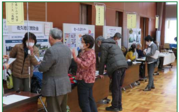
昨年度の佐久地域タウンミーティング

自分のスキルや特技を活かしたい!何かを始めたいけど何をしたいかわからない・・・ NPO、ボランティア、地域活動等の情報が欲しい、関心がある、こんな方をお待ちしています!