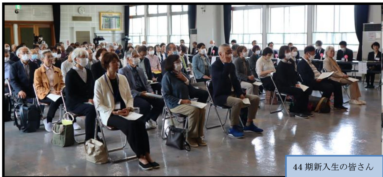
44期新入生の皆さん