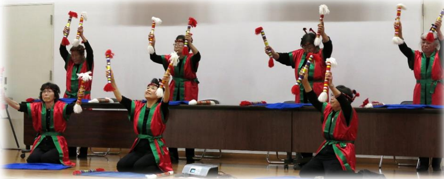
銭太鼓を楽しむ会のみなさん