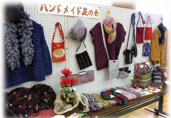
ハンドメイド友の会