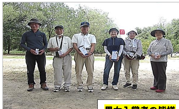
男女入賞者の皆様

好天続きの真夏日開催となりました。昨年に続き安曇野市豊科の水辺マレットゴルフ場で開催しました。犀川河川敷利用のフラットなコース。常に整備が行き渡っている快適なマレットゴルフ場ですが、乾燥しており難しいコースとなっております。松本地区の参加者が多く地元の熟達者との交流大会となりましたが昨年同様地元の会員の入賞者が多い結果となりました。マレットゴルフ競技は長野県ゆかりのスポーツです。又、長寿長野県の一翼を担ったシニア世代には健康増進に最適な運動と思われます。マレットゴルフ競技の健康づくりと地域交流は、お勧めです。