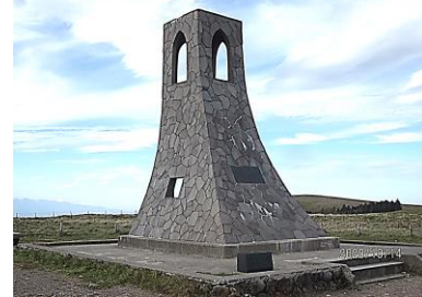
松本美ヶ原高原・美しい塔 標高二千m最高の展望です。