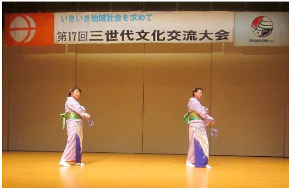
華やかな最初を飾るお祝いの舞を有難う御座いました。 《ごより会Ⅱの皆様》