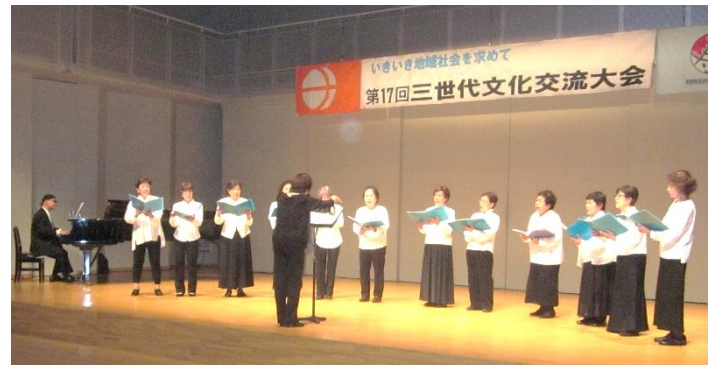
《コーラス“りんどう”》グループの皆様 なじみの曲のコンサート。女性ハーモニーを楽しみました。 全体に響き渡り楽しい歌声でした。