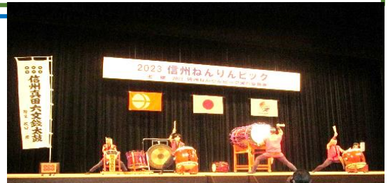
開会セレモニー《真田六文銭太鼓》