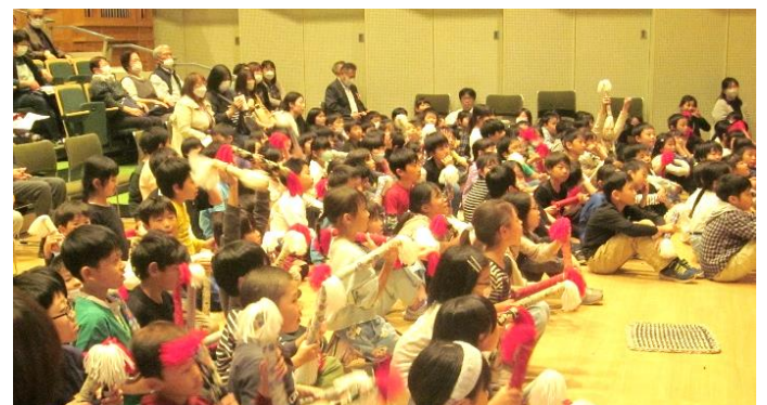
銭太鼓演技と一緒に楽しみました。