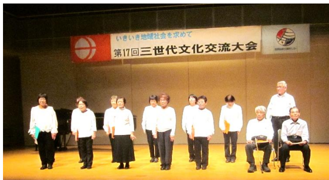
《安曇野地域会・童謡唱歌を歌う会》の皆様 男性とのハーモニーが素晴らしい混声合唱団