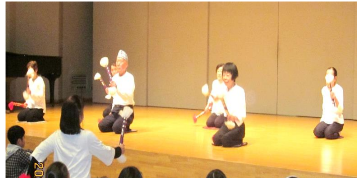
《銭太鼓を楽しむ会》の皆様 見学者の銭太鼓の実演があり会場全体が熱気に包まれました。