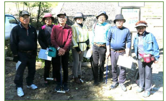
↑伊那から7名が参加しました