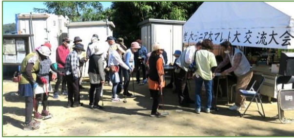
受付 12:30 ↑