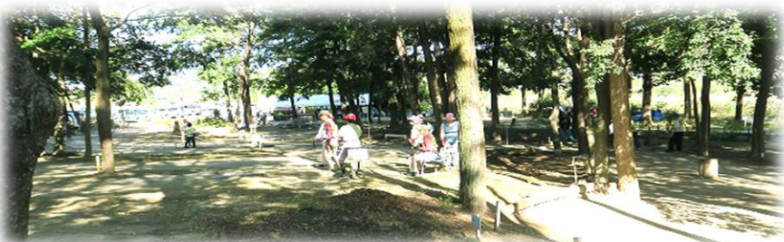
ゲームは期を混合して36ホールで始まりました 13:30