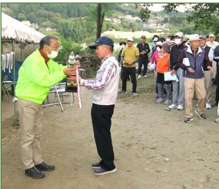
優勝 34期 (昨年に続き連覇)