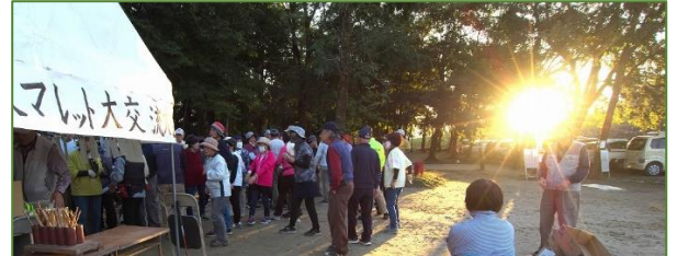
↑ 日が沈むころ閉会式 16:00