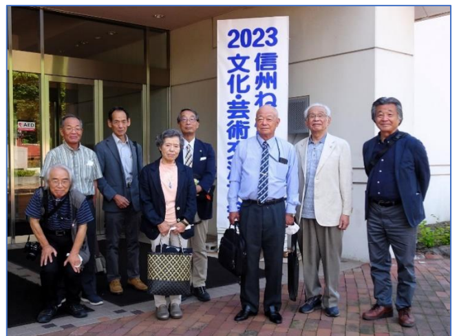
南信州地区賛助会 参加の皆さん