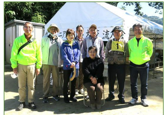
↑大会を支えた賛助会役員