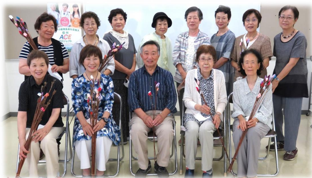
作品を手にとって、全員で集合写真

(編集後記) 新型コロナウイルス感染症による行動制限がない久しぶりの夏です。各地で夏祭りが開催され、しばらく会っていなかった旧友と親交を深めた方も多いかと思います。しかし感染者数は徐々に増加傾向とのニュースも聞かれます。引き続き感染対策を行いながら、グループ活動を活発に行ってゆきましょう！