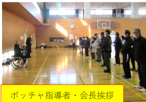
ポッチャ指導者・会長挨拶