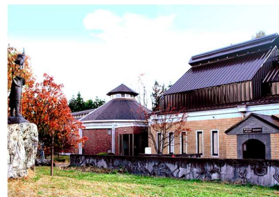
朝日美術館・歴史民俗資料館 (朝日村古見1308) 日本画家三村悠紀他収蔵 (ホームページ)