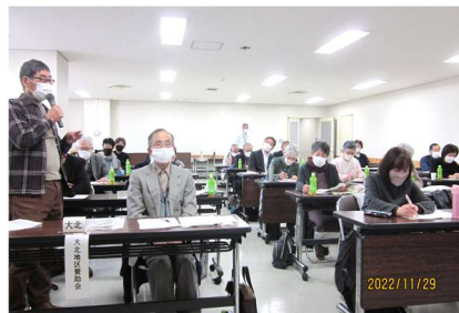
熱心な討議と意見発表