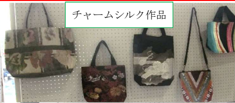
チャームシルク作品