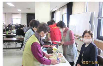
『チャームシルク』グループ による作品の即売会