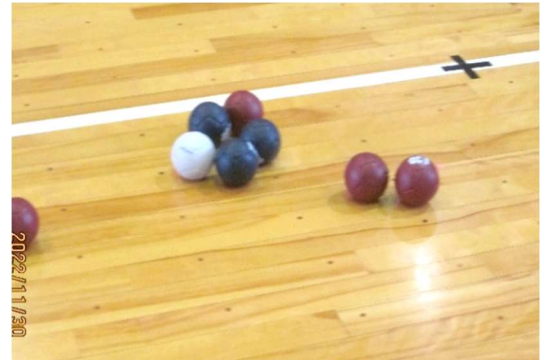
先行チームが白色のジャックボールを投げ第1投を行う。相手チームが第2投をし、第3投以降は、ジャックボールより遠いチームが行います。ジャックボールに近いチームの得点となり本試合は、青チームの2-0の勝利となる。

なく行われ、ジャックボールの動きに一喜一憂しました。又シニア大学生との交流が出来ました。交流会を経験し興味のある方によりサークル活動に発展出来ることを期待しております。又、次年度も「賛助会の事業計画にして欲しい」との意見も聞かれました。