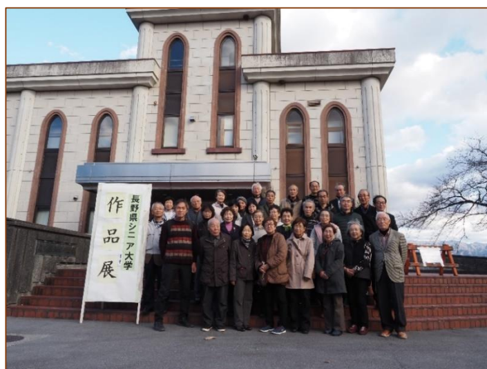
飯田創造館前にて 2学年（42期生）