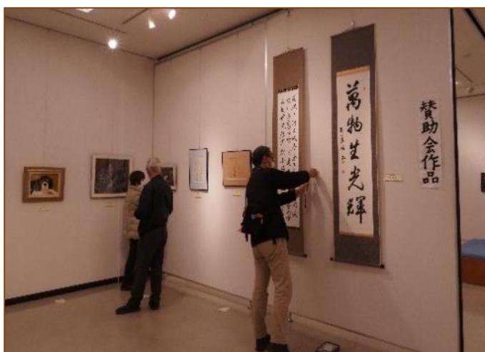
作品展示作業中の賛助会の皆さん

「素晴らしい作品展を味わう時間をありがとうございました 私事ですが、今年は父の病、母の物忘れなど しっかりしていて健康で元気が 当たり前だったのとは違うことに接して、できる限りのことを改めて父と母との時間を、思いと共に大切に感じてきたこの一年でした。シニア大学の方々の句に父母のことを詩っているものが多く、涙が出ました。父母は偉大ですね いつまでも心の支えですね。そして書、短歌、作品、絵、勉強、写真、生活にそれがあることがどれだけ の豊かさ、生きがい、心にどれだけのもを自らに与えていらっしやることか、又、そうした活動の場、発表の場、この建物自体、味わい深く重要なものを沢山 生み出してきた創造館なんとしても、ここにあらねばいけません。」（50代女性）