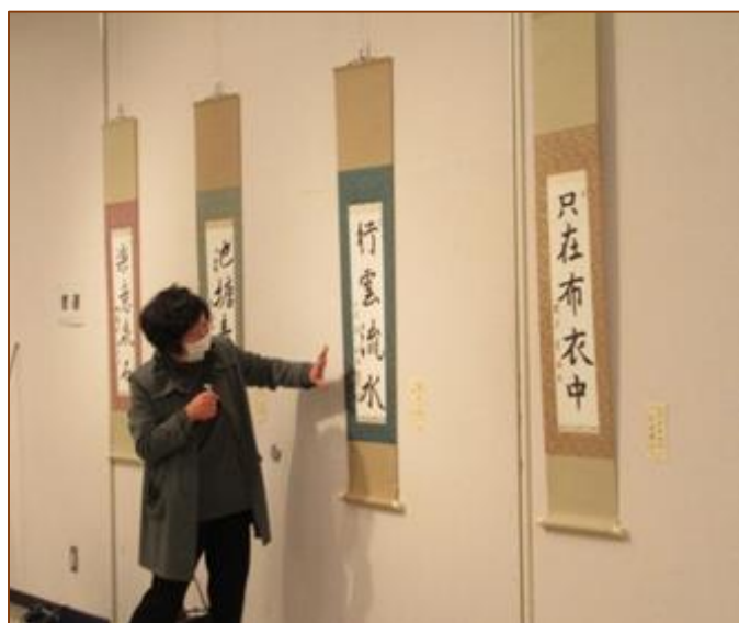
作品の講評 実技講座の先生方からそれぞれの作品や機材についての、説明を受けました