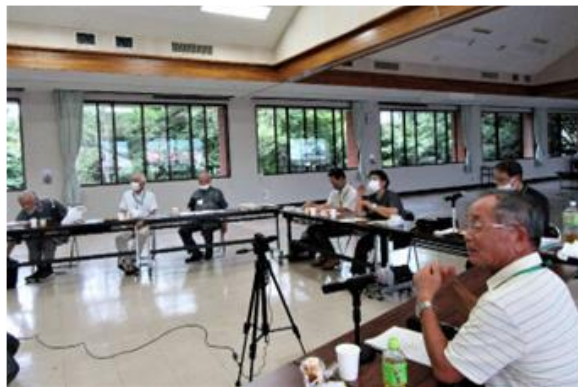
オンライン会議 風景