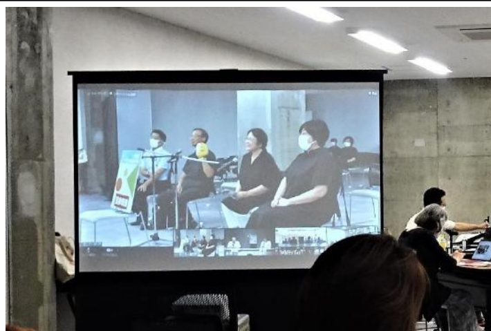
飯田駅前「ムトスびらざ」飯伊会場