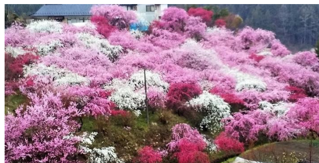
中沢地区では、春先、あちこちで花桃が満開と なり、桃源郷のようです (2020.4.15)