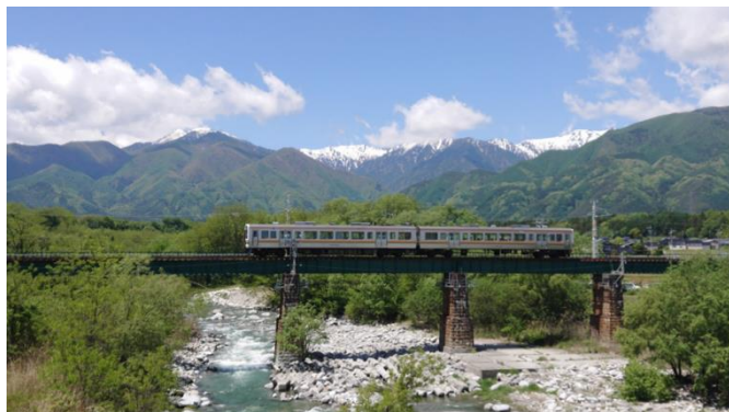
飯田線に揺られながら地酒と車窓を楽しんでみたい です