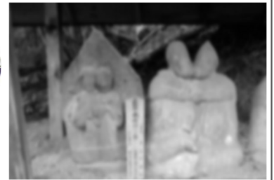
安曇野市の道祖神 明科せっぶん道祖神