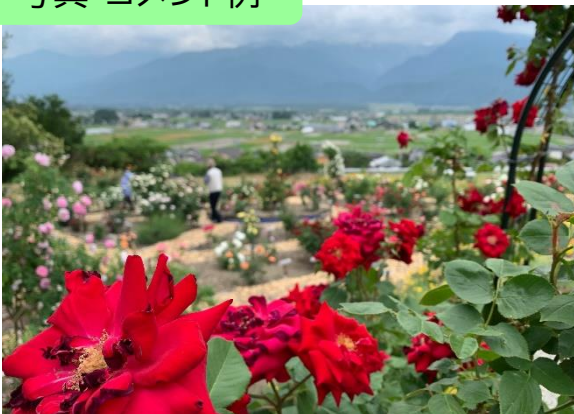
池田町会染の「あづみ野バラ園」北アルプスを望む 高台で10月頃まで楽しめるそうです。 大北地区賛助会 佐藤雅法