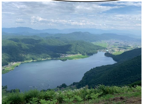
小熊山山頂からの木崎湖と大町市街地。 暫く時間を忘れさせてもらいました。 PN 安曇野産 座敷わらし