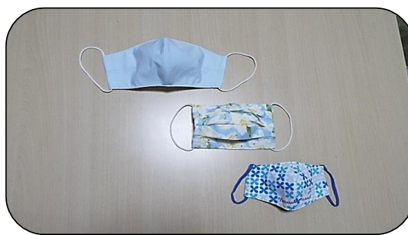
ダーツ入りでフィット感最高！ ワイヤー入りで便利！ リバーシブルでかっこいい！