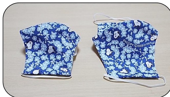
親子ペア作品 （スヌーピー柄が可愛いですね！）