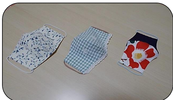
おしゃれなデザインの作品ですね！ フリルも付いてかわいい！ 無地と花のデザインが新鮮！