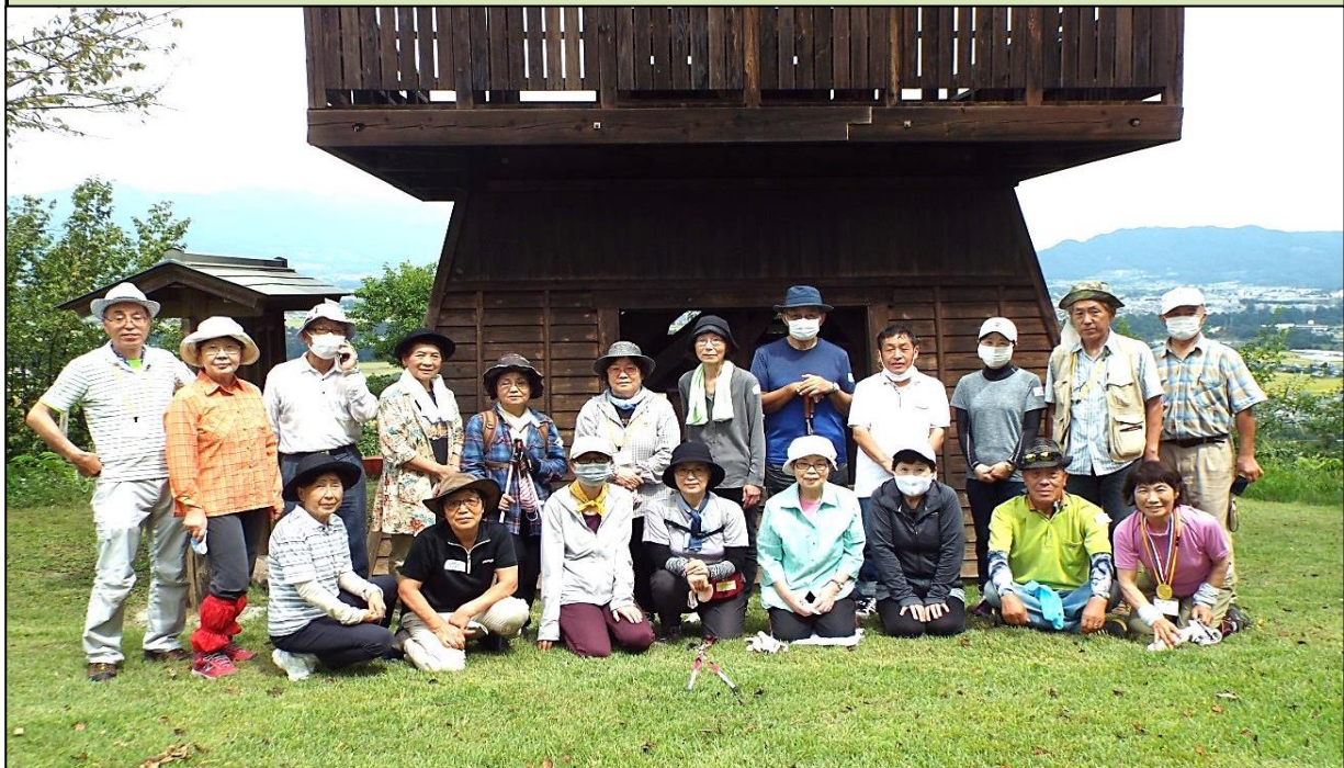
(頂上の展望台の前にて記念撮影)