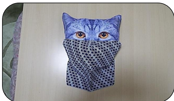
忍者マスク （コーラスに便利と聞きました！）

なお、現物は、賛助会員活動発表会及び佐久合同庁舎1階フロアに展示を行いますのでご覧ください。＜佐久合同庁舎展示期間：令和2年12月3日（木）～令和2年12月17日（木）＞