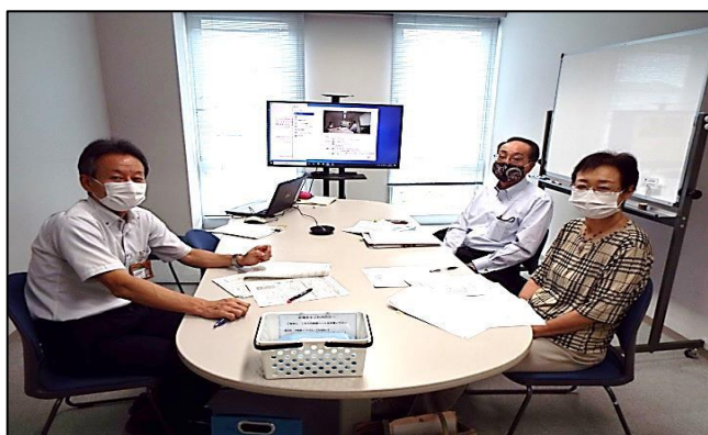
地区賛助会連絡協議会役員 (選挙結果・任期 2年)