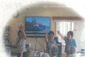
じゃんけんゲーム (みんなでおこびる)

★ みんなでおこびる ・・・福祉施設で歌や折り紙、あやとりなどを通して交流する。