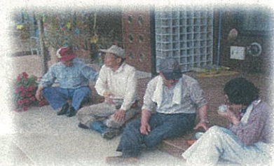
ちよっとひといき(お助け6レンジャー)

これらの活動は、各町村の社会福祉協議会の担当者やシニア活動推進コーディネーターが、関係機関と連絡調整を行い、グループとの橋渡しを行っています。社会参加活動も2年目を迎え、自信をもって意欲的に活動しています。