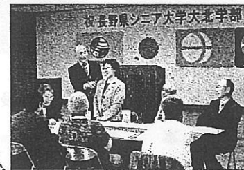
オリエンテーション