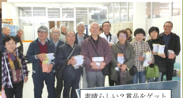
素晴らしい? 賞品をゲット