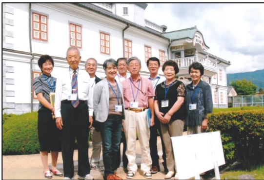
旧開智学校案内班の皆さん

(重文)旧開智学校案内班はシニア大学をきっかけにグループを立ち上げ、重要文化財である旧開智学校について学習し理解を深めるとともに、観光客への案内活動を行い地域文化の紹介に努めています。