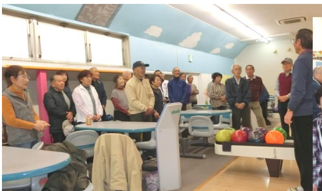
野畑活動グループ推進委員長の開会宣言