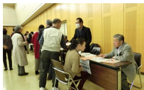
松本地区賛助会について説明をする

日 時：12月12日(火) 13:00~15:30 場 所：松本合同庁舎 講堂 参加者：シニア大学松本学部2年生 シニアの参加を求める団体、相談窓口 内 容：シニア大学を卒業し、地域で活動したいシニアの皆さんと、シニアの参加を求める団体との交流の場とする。 ：松本地域で活動している団体やグループが出店し、シニアの皆さんとの交流や情報交換を実施する。 ：松本地区賛助会をはじめ各団体20店が参加して、シニアの皆さんとの情報交換。