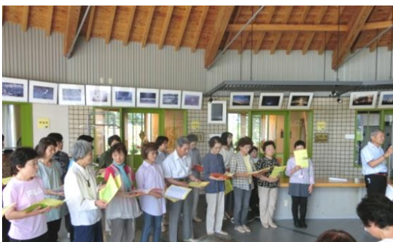
安曇野地域会 交流会の様子

は十分社会貢献している。前を見て誇りをもって進もう」との主旨のあいさつがありました。