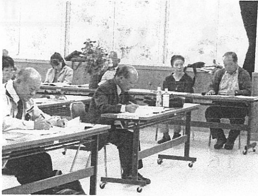
シニア大学の講座①