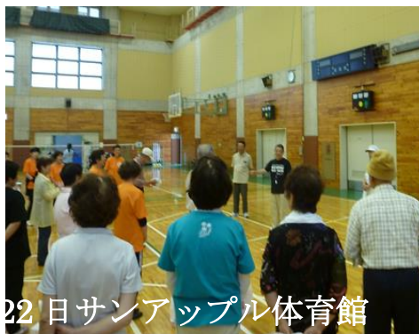
長野地区賛助会「親睦スポーツ交流会」 6月22日サンアップル体育館