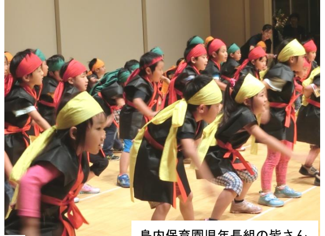
島内保育園児年長組の皆さん