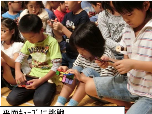
平面キューブに挑戦 島内小3年生と世代交流会