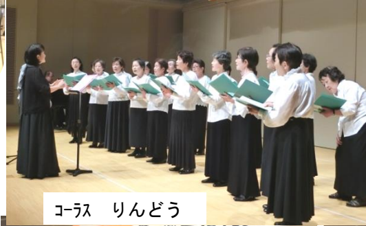
コーラス りんどう