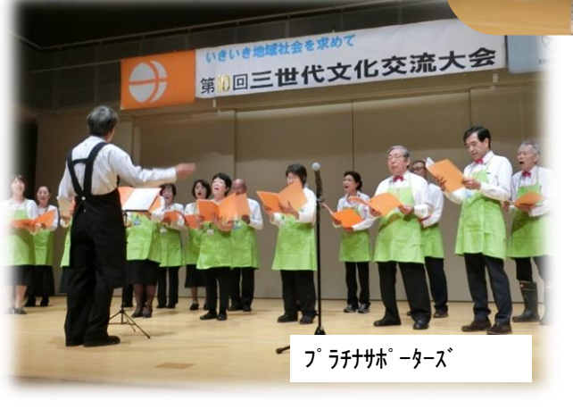
プラチナパートナーズ