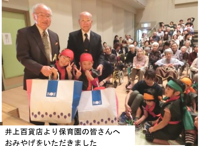
井上百貨店より保育園の皆さんへ おみやげをいただきました