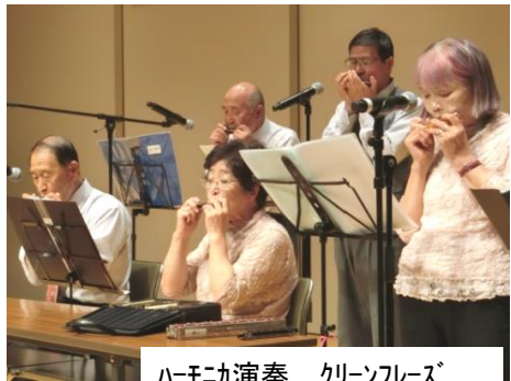
ハーモニカ演奏 クリーンフーズ