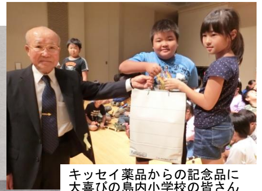
キッセイ薬品からの記念品に 大喜びの島内小学校の皆さん

歌や踊り250人が披露 松本で文化交流大会 県長寿社会開発センタの市音楽文化ホール ター松本支部賛助会は、毎秋恒例の三世 このほど、松本市島内 代文化交流大会を開