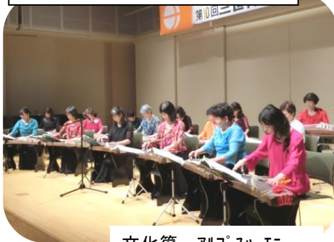
文化箏 アルプスハーモニ

「伊から浦豊 要などの活躍は居な 250人が出演 いる市民らが出演し を元気づけた。を披露して、10 を踊りなど多彩 た。会場近くにある地 を披露して、10 元の島内保育園の発表 目を迎えた大会 では、年長居約50人が 上げた。 鉢巻きに法被姿でステ る地域で歌や踊 ージに登場し、運動会