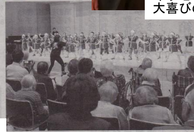
歌や踊りが多彩に催された交流大会

「伊から浦豊 要などの活躍は居な 250人が出演 いる市民らが出演し を元気づけた。を披露して、10 を踊りなど多彩 た。会場近くにある地 を披露して、10 元の島内保育園の発表 目を迎えた大会 では、年長居約50人が 上げた。 鉢巻きに法被姿でステ る地域で歌や踊 ージに登場し、運動会