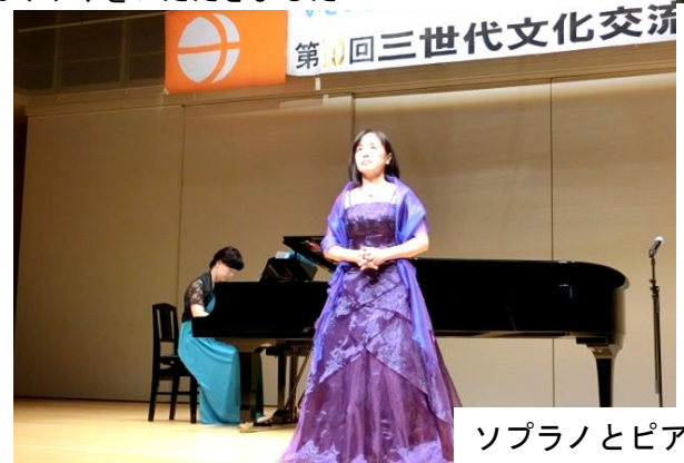
ソプラノとピアノ演奏