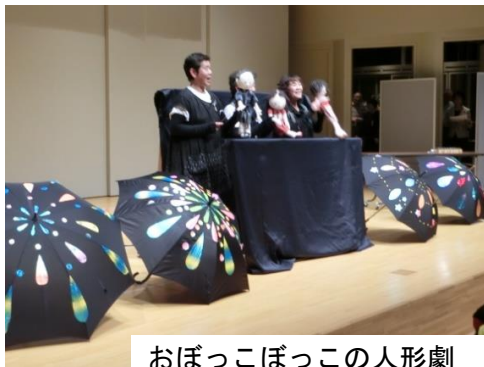
おぼっこぼっこの人形劇