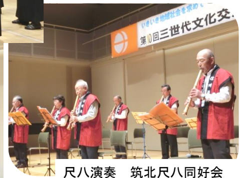
尺八演奏 筑北尺八同好会