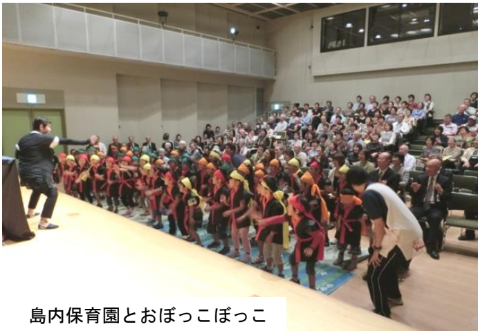
島内保育園とおぼっこぼっこ