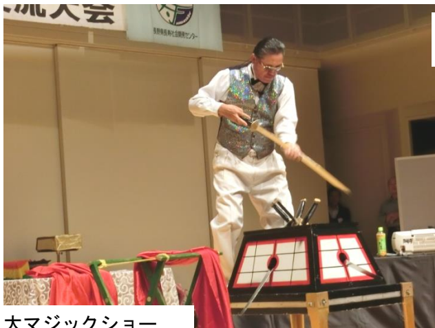
大マジックショー