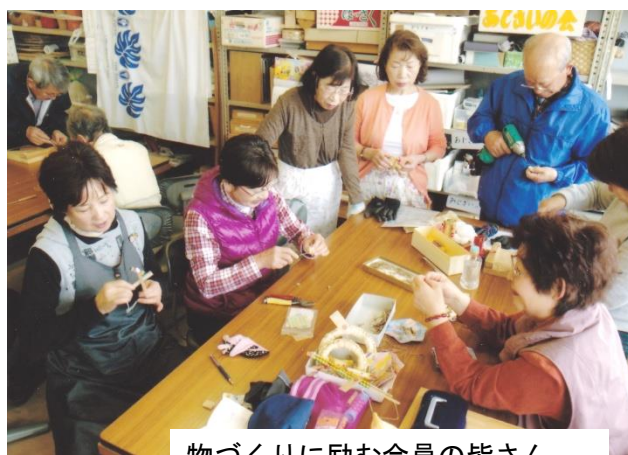
物づくりに励む会員の皆さん