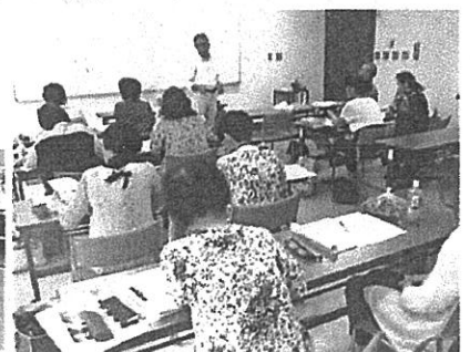
講師から薬草を学ぶ