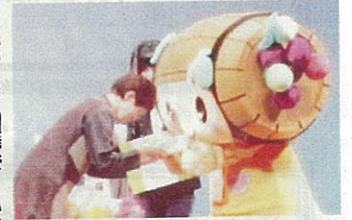
富くじ抽選会 ふたれも当選!