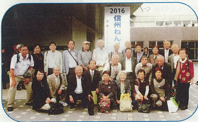
飯伊支部 ねんりんピック参加者

開会式・式典では、功労者表彰が行われました。式典に続き、各地区で様々な活動に取り組んでいるグループの活動事例紹介が行われたほか、ロビーでは中信地区25団体のブースがおかれ、さまざまな活動が紹介されました。午後からの「みんなで意見交換会」では「人生二毛作」について話し合われました。また、別会場(塩尻総合文化センター)では長野県高齢者作品展が開催されました。