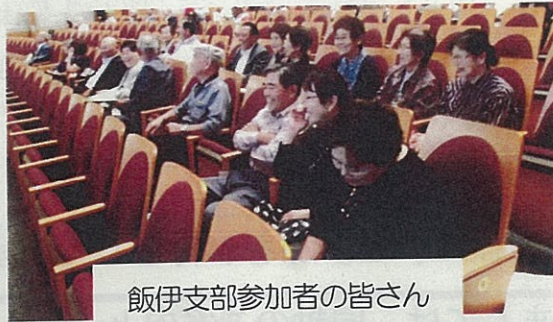
飯伊支部参加者の皆さん