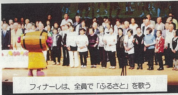
フィナーレは、全員で「ふるさと」を歌う