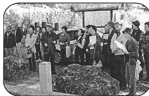
写真は高森村福徳寺訪問時のもの