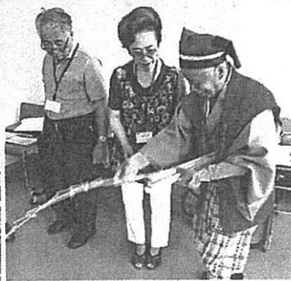
南京玉すだれの練習