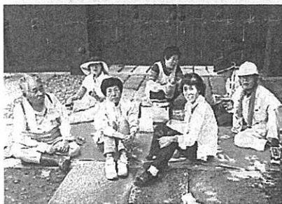
図書館の清掃作業