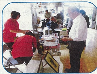
「人生二毛作」活動見本市