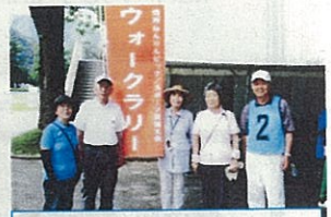
ニュースポーツクラブA