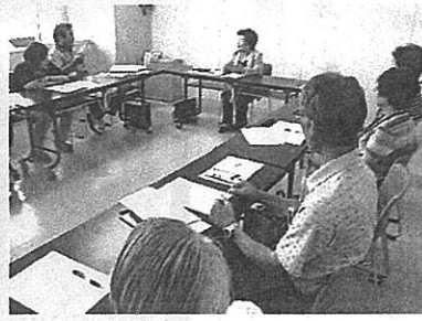
傾聴ボランティアの研修