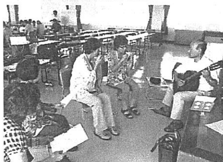
施設訪問のための練習