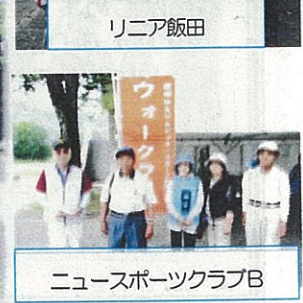
ニュースポーツクラブB