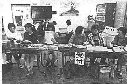
華麗なる音楽祭受付