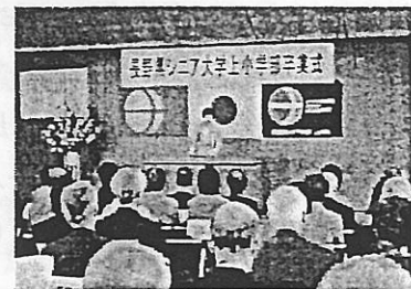
高村京子県議会議員の来賓祝辞を聞く学生

卒業生は上田市63名、東御市10名、青木村5名、坂城町2名、千曲市1名の81名(男性36名、女性45名)で平均年齢72.2歳、最高齢89歳です。卒業証書授与、皆勤賞授与(46名)に続き、長棟学部長式辞、学長(知事)ビデオレター、来賓祝辞をいただき、戸泉嘉治自治会長送辞、岡部自治会長謝辞でつつがなく終了しました。式後全員で記念撮影をし、「ささや」にて三矢(みつや)会を発足