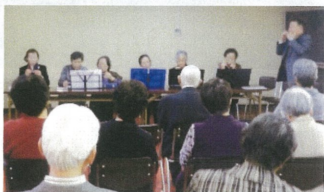
写真は当日の様子です。