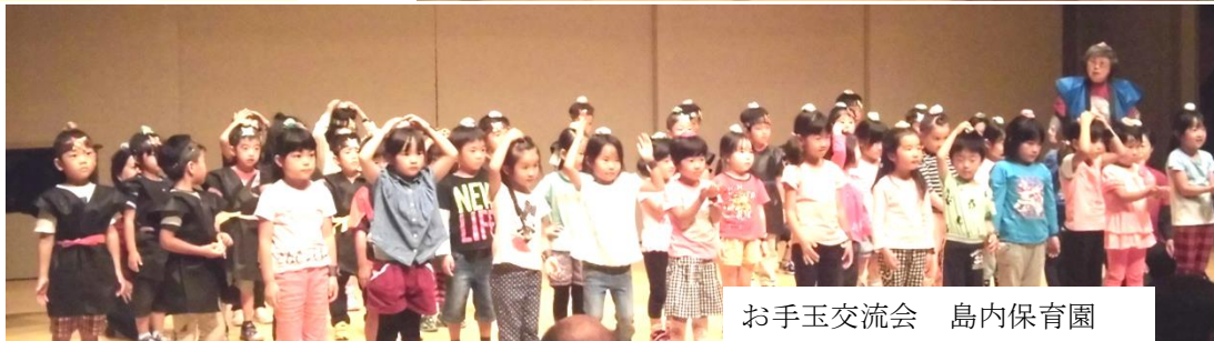
お手玉交流会 島内保育園