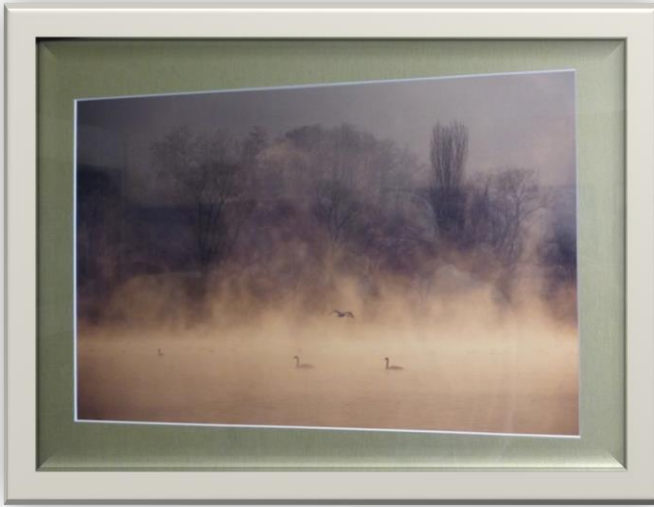
凍て付く朝 鳥羽孝哉様 (写真)

松本地区賛助会では13人の皆様が出展してくださいました。今回は入賞作品を紹介します。