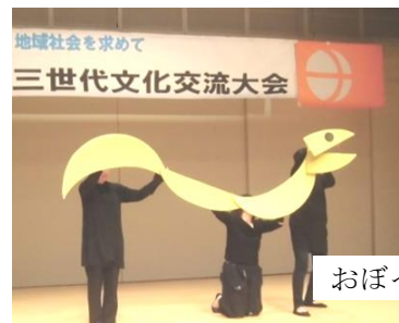
おぼっこぼっこの皆さん