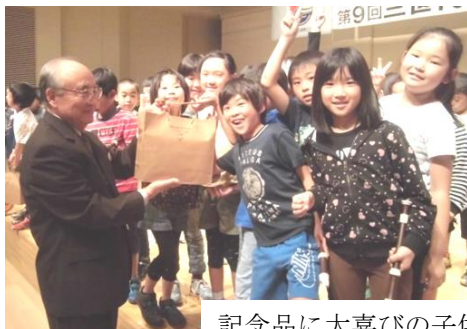
記念品に大喜びの子供たち

世代を超えて ステージ発表 音文で交流大会 県長寿社会開発セン ター松本支部賛助会 は2日、松本市島内の市 音楽文化ホールで、第 9回三世代文化交流大 会を開いた。松本地方 の保育園児から80代 のお年寄りまで約350 人が参加し、世代を超 えたふれあいの楽しい ひとときを過ごした。 ステージ発表では、 お年寄りたちが日本舞 踏や書道、コーラスな どを披露し、近くの島 内小学校の3年生95人 がリコーダーを奏でた り、合唱したりして会 場を沸かせた。秋恒例 話していた。 (小野原裕一)