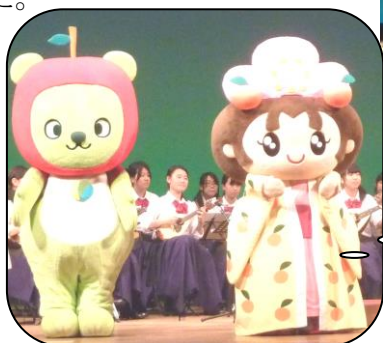
アルプちゃん和杏姫様