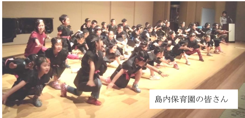
島内保育園の皆さん