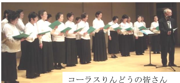
コーラスりんどうの皆さん