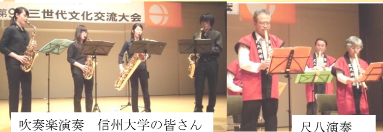
吹奏楽演奏 信州大学の皆さん