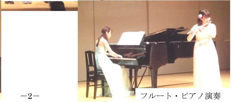
フルート・ピアノ演奏