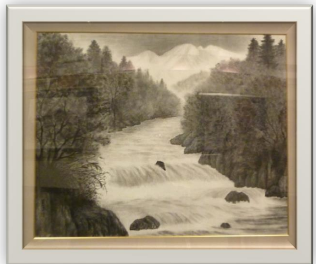
溪流 由井倉子さん (日本画)