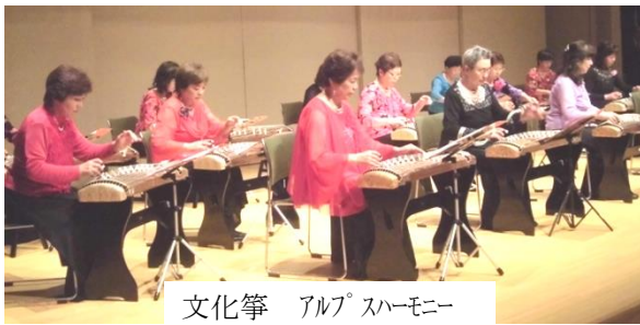
文化箏 アルプスハーモニー