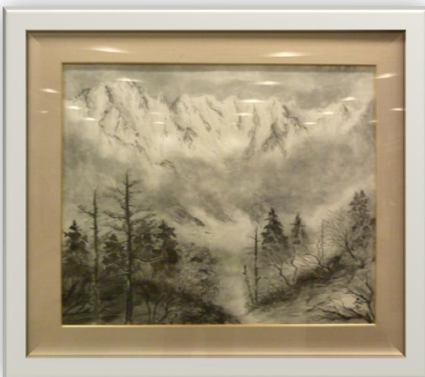
穂高連峰 寺沢正吉様 (日本画)