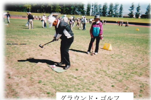
グラウンド・ゴルフ

交流大会には、県下各地から 188 名の選手が参加され、楽しく元気に交流が図られました。