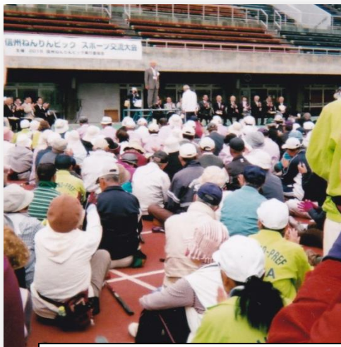
開会式であいさつする、加藤長野市長

2015 年信州ねんりんピック、スポーツ交流大会が、長野市運動公園総合運動場と犀川第 2 運動場で開催されました。10 種目約 1000 人の選手が競技へ参加しました。松本地区賛助会からは、ペタンク、グラウンド・ゴルフ、マレットゴルフに参加して活躍されました。