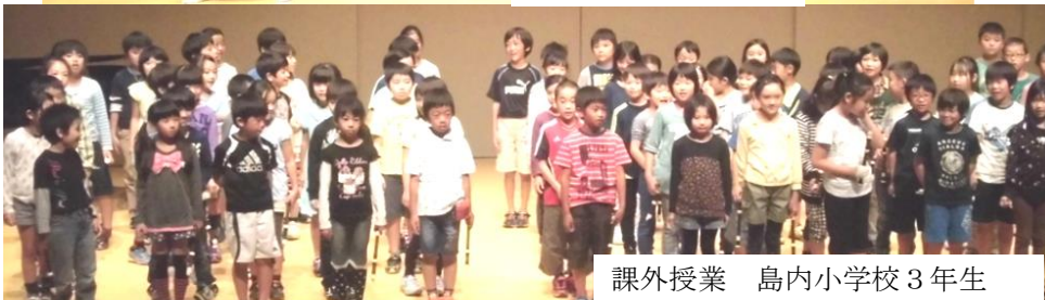
課外授業 島内小学校3年生