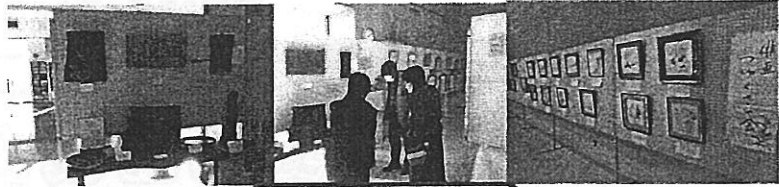
作品説明する作者